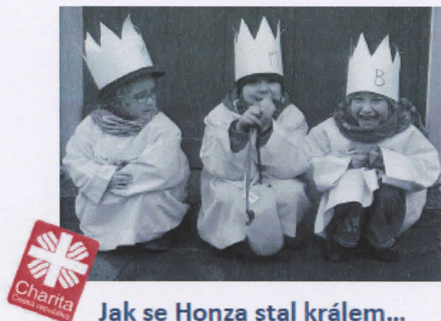
Jak se Honza stal králem...

Pojď s námi zažít sobotní odpoledne plné očekávání, dojetí, radosti, zpěvu a někdy i dobrodružství. Uděláš něco dobrého pro naši společnost, budeš s kamarády na čerstvém vzduchu a nebude chybět něco na zub.