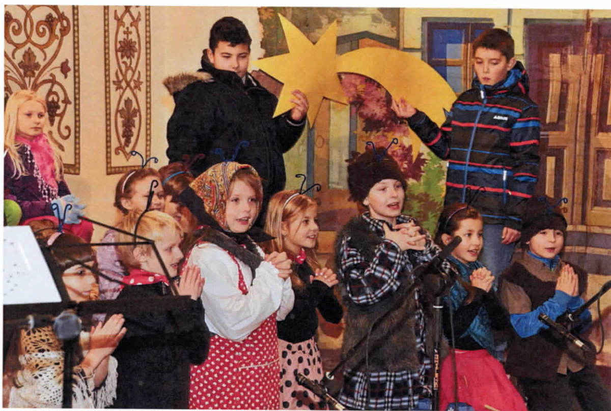
Podvečer tvá čeládka, co k slepici kuřátka, k ochraně tvé hledíme, laskavý Hospodine. (modlitba Broučků)

Touto cestou bych chtěl poděkovat všem, kteří přispěli na holčičku, vlastně dnes již slečnu Sumitru, dále všem účinkujícím, pořadatelům - našim pedagogům, klubu důchodců, hasičům a panu starostovi. Ještě jednou velké díky za vaši přízeň.